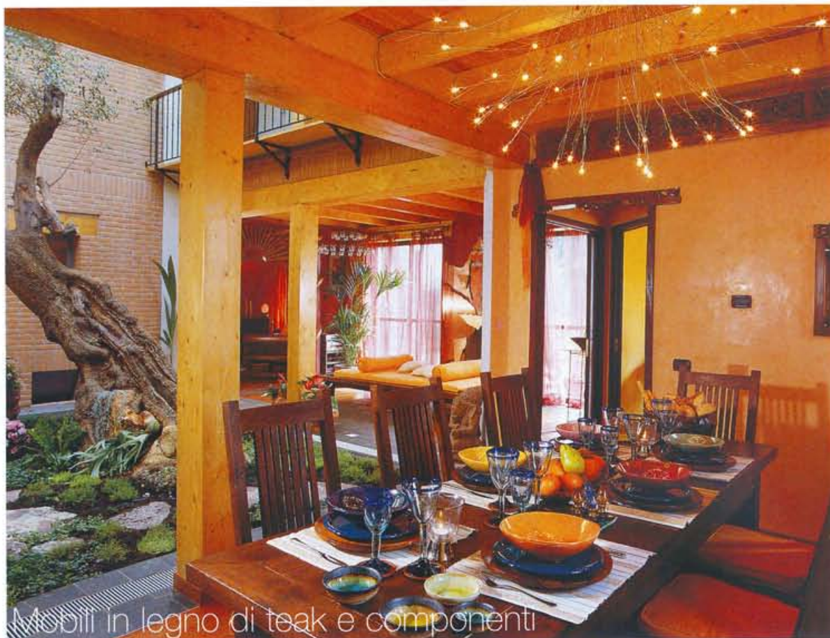
Mobili in legno di teak e componenti d'arredo esotici in stile balinese